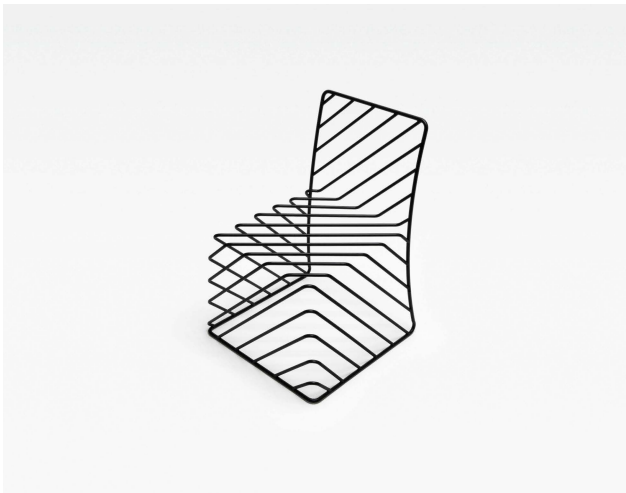
thin black lines for Phillips de Pury furniture collection 2010.09