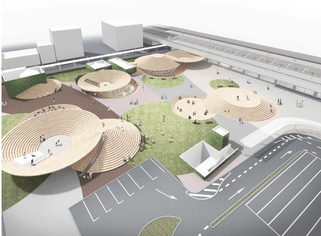
天理駅前広場空間デザインプロジェクト 天理市 2014.05