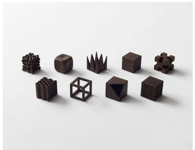
chocolatexture for Maison et Objet chocolate 2015.01