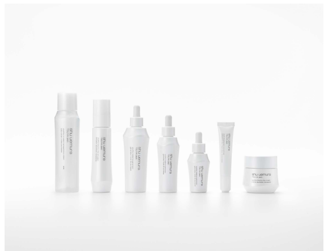
TSUYA skin for shu uemura cosmetics 2014.11