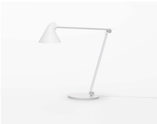
NJP table for Louis Poulsen desk lamp 2015.04