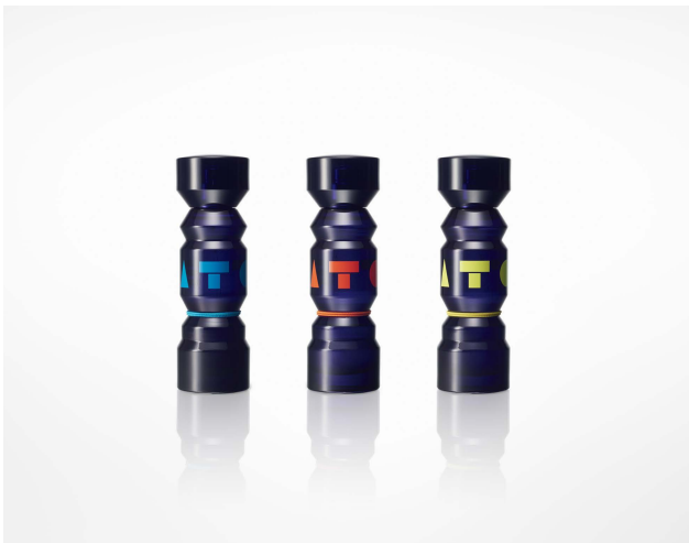
TOTEM for KENZO PARFUMS parfum bottles 2015.09