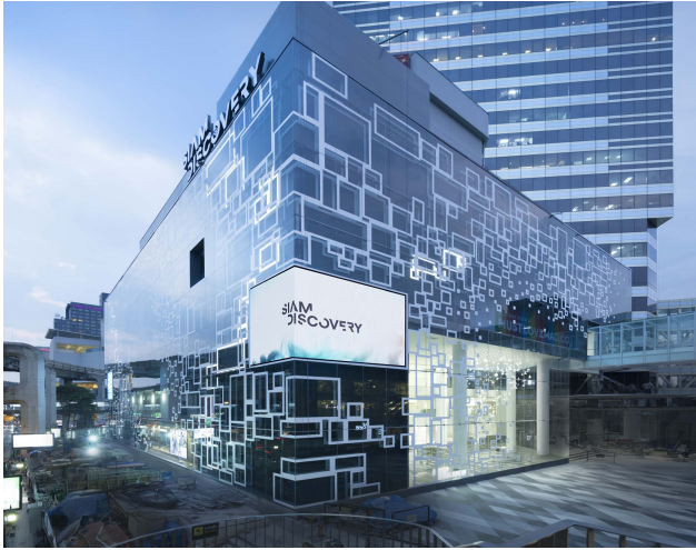
Siam Discovery Siam Piwat 2016.05