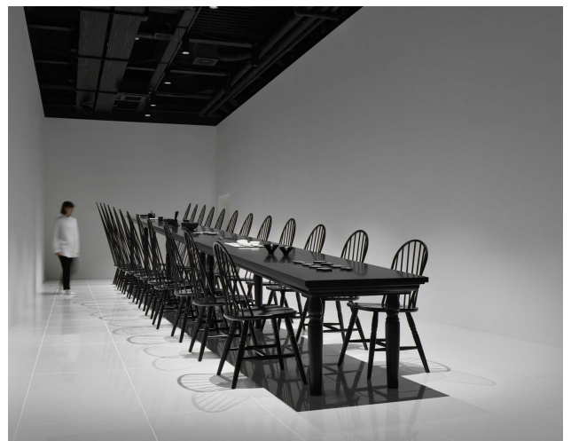
colourful shadows for Expo in Milan EXPO design 2015.06