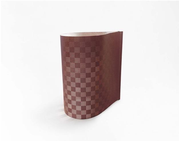
surface for Louis Vuitton lamp 2013.04