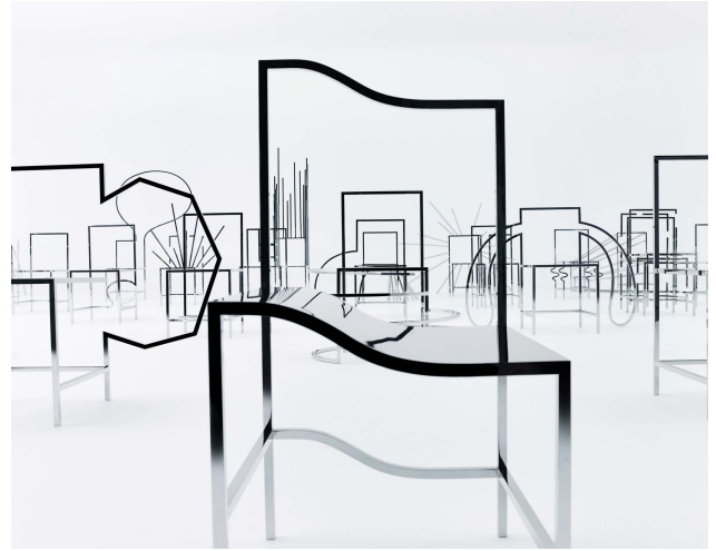
50 manga chairs chairs 2016.04